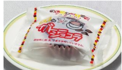
低アレルゲン おこさま ガトーショコラ 100円（税込 108円）97Kcal

小麦粉や卵を使用せず、米粉、豆乳、ココア、砂糖などで作られたガトーショコラです。7大アレルゲン食材に食事制限のあるお子さまも安心して召し上がれます。