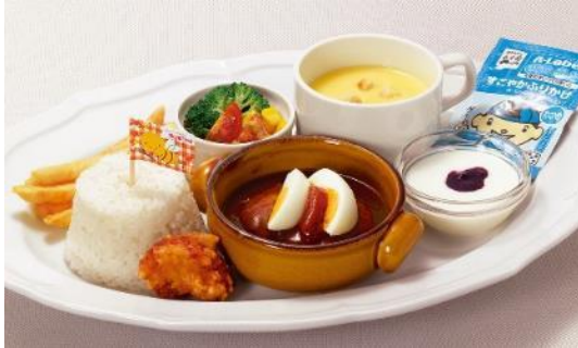
おこさま 煮込みハンバーグプレート 780円（税込 842円）

ロイヤルホストの洋食をメイン料理に、コーンのポタージュやフライドポテト、からあげ、サラダ、小さなブルーベリーヨーグルトと、食事とデザートが揃ったワンプレート。ロイヤルホストが培ってきた確かな品質で、豊かで楽しい食の時間をお子さまに提供します。