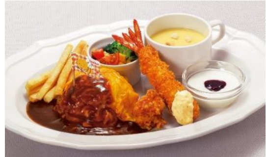
おこさま オムライス&エビフライプレート 880円（税込 950円）879Kcal

「ロイヤルオムライス ～ハッシュドビーフソース～」を小さめにアレンジしドミグラスソースで仕上げました。タルタルソースを添えた天然海老フライも一緒に楽しめる、お子さまも大人と同じようにロイヤルホストの洋食をお楽しみいただける1品。