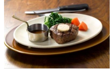
豪州産ヒレステーキ ～温ケール&ブロッコリー添え～ 2,880円（税込 3,110円）