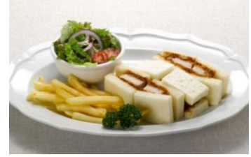
国産銘柄豚ロースカツサンド 1,080円（税込 1,166円）

シェアにおすすめのラージサイズサラダ。スパイシーなチキン&シュリンプ、チーズ、ベーコン、アボカド、ポイルエッグにたっぷり野菜を盛りこみました。クリーミーでほんのりスパイシーなコブサラダドレッシングをかけて召し上がれ。