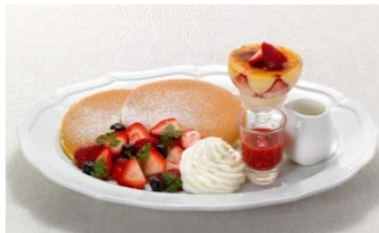
ストロベリーパンケーキ & 苺のブリュレ 1,280円（税込 1,382円）

さくっと歯切れよく柔らかいロースカツを、食べやすいサンドイッチに。フライドポテトとサラダを添えました。