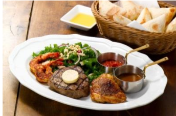
豪州産ヒレステーキ & グリルチキン&シュリンプ ギャザリング・ブロッカー 自家製パン付 2,930円（税込 3,164円）

柔らかく繊細な味わいを楽しむ豪州牛のヒレステーキ。 様々な料理が楽しめるギャザリング・ブロッカー、肉の旨みを堪能するヒレステーキピラフ、話題の野菜「ケール」を温めて調味し、ブロッコリーとともに添えたステーキの3種類から選べます。