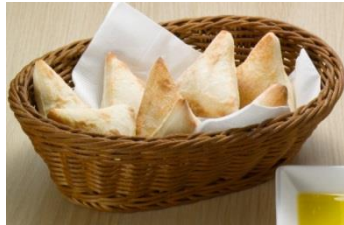
自家製パン ※おかわり自由 【単品】270円（税込 291円） 【自家製パンセット（パン・ドリンクバー付）】 プラス 490円（税込 529円）

オリーブオイルを練りこんだフォカッチャタイプのパンは、もちもち・ふわふわの食感。生地から手作りしてお店で毎日焼き上げます。そのままでも、オリーブオイルをつけてもおいしくお召し上がりいただけます。 ※300円以上のお食事ご注文の方に、お得なセットもございます。