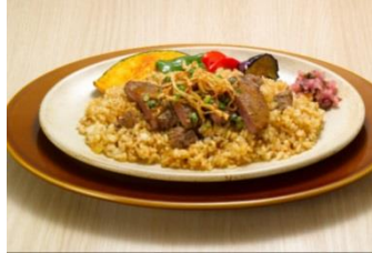
豪州産ヒレステーキピラフ ～ガーリック風味～ 1,780円（税込 1,922円）