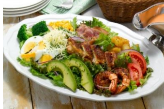
グリルチキン・シュリンプ・アボカドの ボリュームサラダ ～コブサラダドレッシング～ 1,480円（税込 1,598円）

オリーブオイルを練りこんだフォカッチャタイプのパンは、もちもち・ふわふわの食感。生地から手作りしてお店で毎日焼き上げます。そのままでも、オリーブオイルをつけてもおいしくお召し上がりいただけます。 ※300円以上のお食事ご注文の方に、お得なセットもございます。