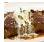
ガーリック クリームソース