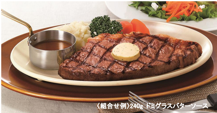
〈組合せ例〉240g ドミグラスバターソース

高品質な CAB ブランドのアンガスビーフを、チルド管理されたかたまりの状態から店舗で手切りして調理。きめ細やかな肉質とほどよい脂身のあるサーロインステーキをご用意しました。焼きたての美味しさを味わっていただくために、ロイヤルホストオリジナル“美濃焼のステーキ皿”で提供します。