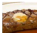
ドミグラス バターソース