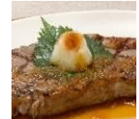
おろしゆず ぼん酢ソース

ロイヤルの歴史と積み重ねられた技術から生みだされた、ステーキが引き立つソースです。