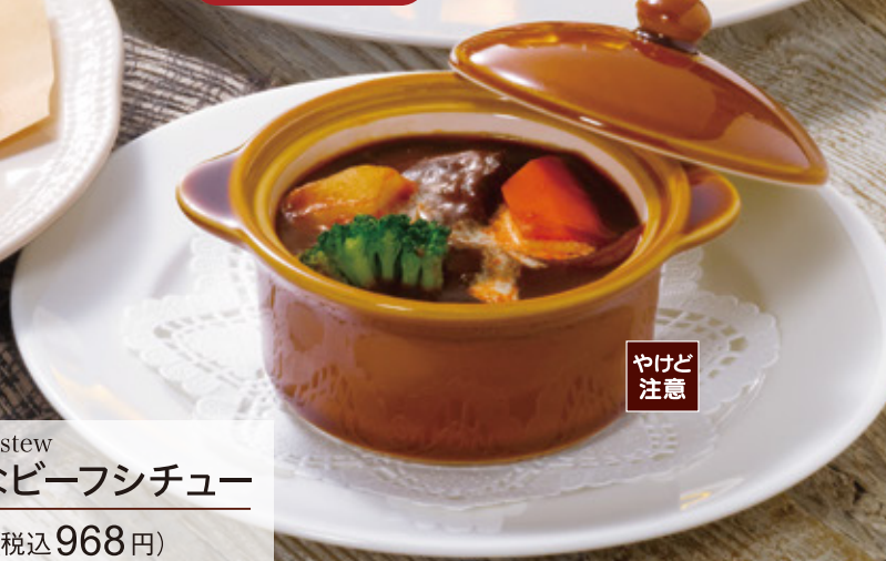
Small beef stew ちいさなビーフシチュー 880円 (税込 968円)