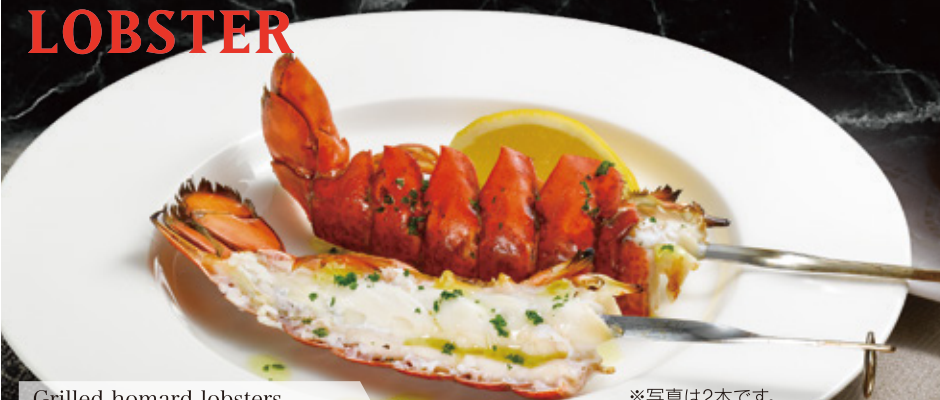
Grilled homard lobsters オマール海老のグリル 2本 1,740円 (税込 1,914円) 1本 880円 (税込 968円)