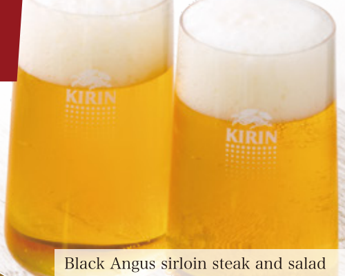
Black Angus sirloin steak and salad 75gアンガス サーロインステーキサラダ 1,780円 (税込 1,958円)