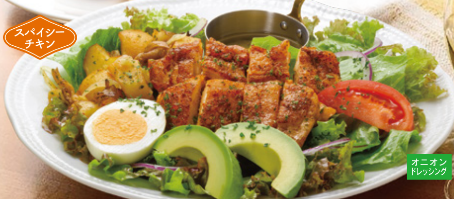
スパイシー チキン