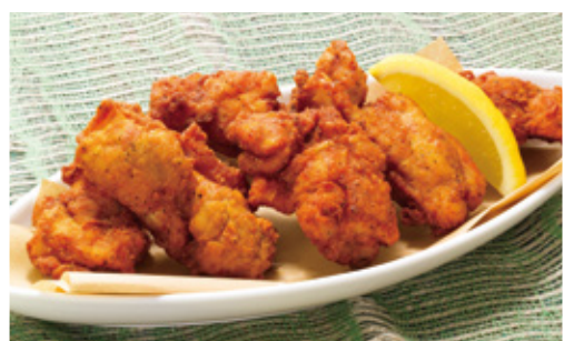
Fried chicken フライドチキン 630円 (税込 693円)