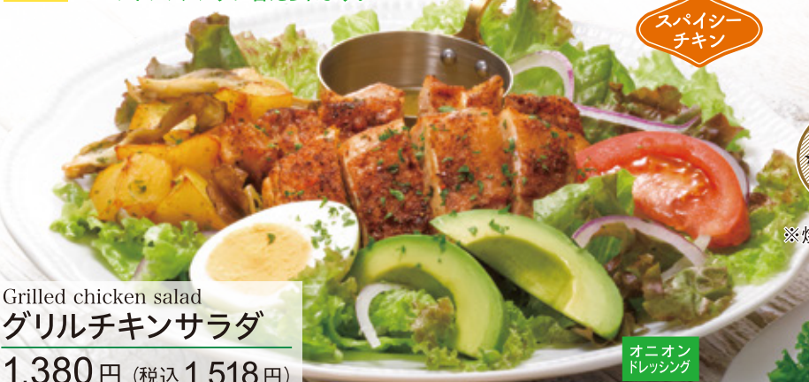
Grilled chicken salad グリルチキンサラダ 1,380円 (税込 1,518円)

コーン ドレッシング オニオンドレッシングは コーンドレッシングに替えられます。