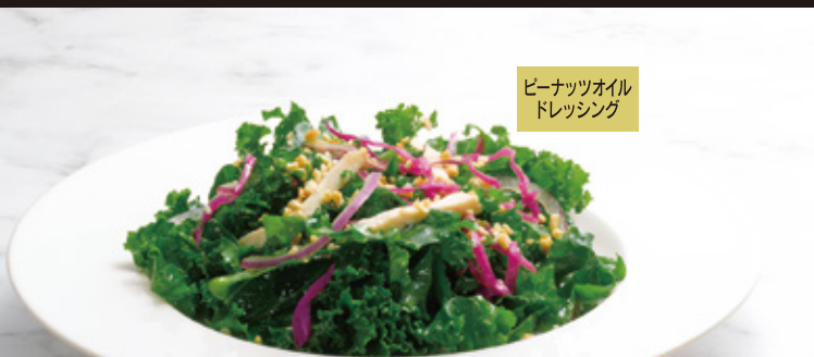
ピーナッツオイル ドレッシング