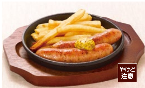
Grilled coarse-ground sausages 粗挽きソーセージのグリル