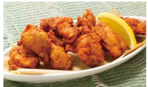
Fried chicken フライドチキン