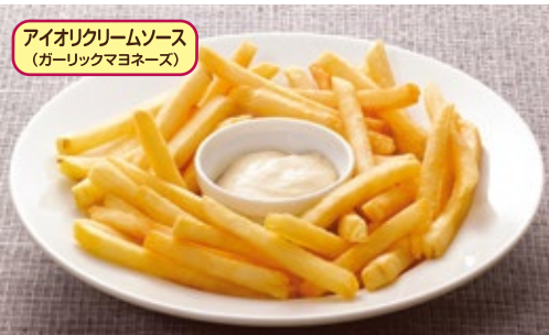
French fries with garlic mayonnaise sauce フライドポテト~アイオリクリームソース付~