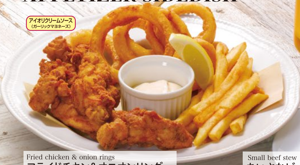
Fried chicken & onion rings フライドチキン&オニオンリング