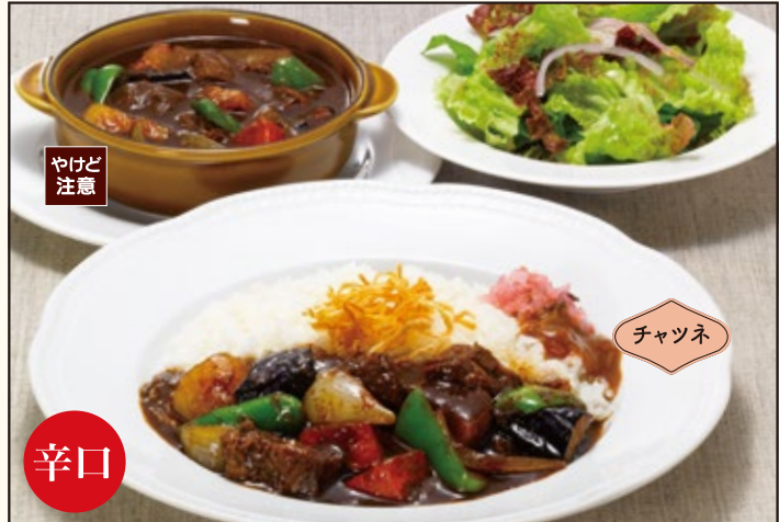
辛口 Kashmir beef curry lunch カシミールビーフカレーランチ サラダ付 1,480円 (税込1,628円)

No pork · No alcohol Vegetable curry with multi grain rice lunch NIKUVEGE ベジタブルカレー&雑穀ごはん サラダ付 1,480円 (税込1,628円)