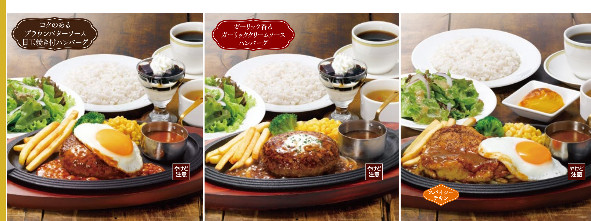
Black × Black hamburger steak special lunch 黒×黒ハンバーグ スペシャルランチ 2,030円 (税込2,233円) Black × Black hamburger steak special lunch 黒×黒ハンバーグ スペシャルランチ 2,030円 (税込2,233円) Grilled chicken special lunch あつあつ鉄板チキン スペシャルランチ 1,830円 (税込2,013円)