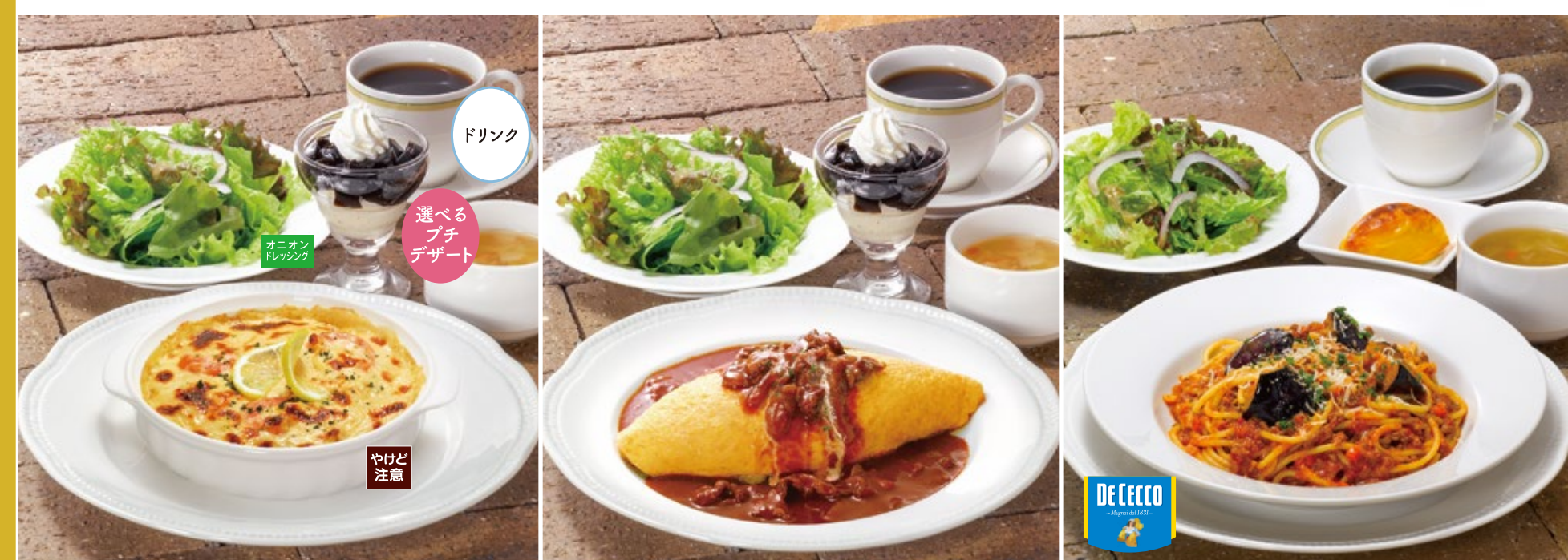
Cosmopolitan doria special lunch コスモドリア スペシャルランチ 1,530円 (税込1,683円) ROYAL omelet rice with hashed beef sauce special lunch ロイヤルオムライス スペシャルランチ 1,630円 (税込1,793円) Eggplant and ground meat spaghetti bolognese special lunch ナスと挽き肉のボロネーゼ スペシャルランチ 1,630円 (税込1,793円)