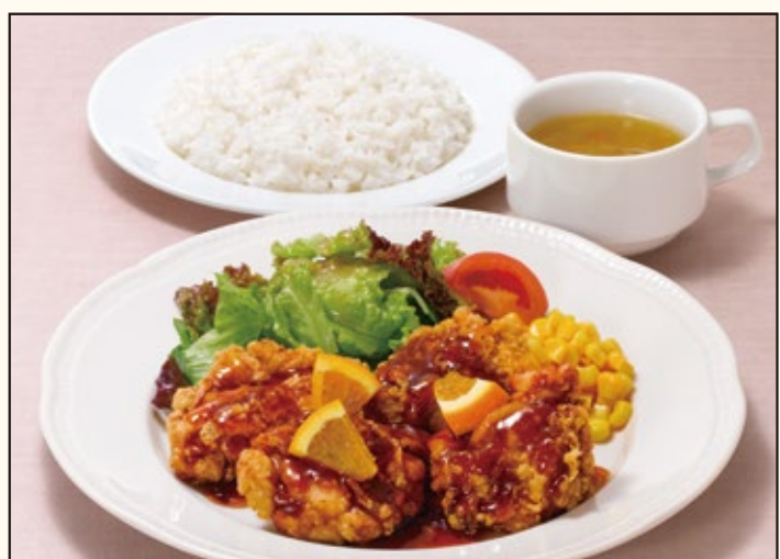
水木金 Fried chicken with orange sauce lunch チキン唐揚げ オレンジソースランチ