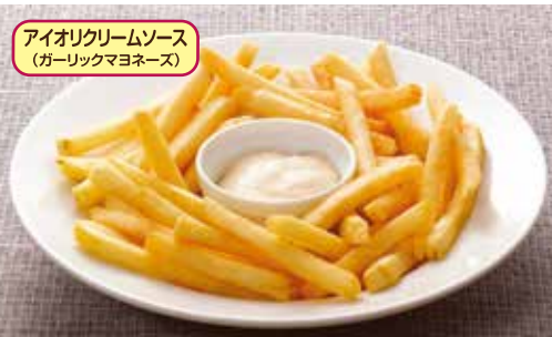
French fries with garlic mayonnaise sauce フライドポテト~アイオリックリームソース付~