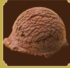
Belgium chocolate ベルギーチョコレート

ベルギーチョコレートの しっかりとした甘さとコクを 合わせもつ、なめらかな 味わいです。