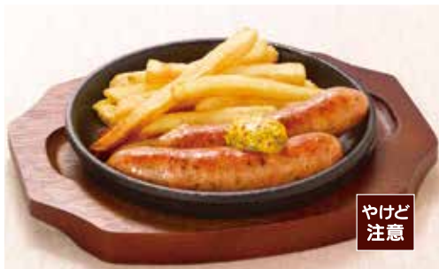
Grilled coarse-ground sausages 粗挽きソーセージのグリル