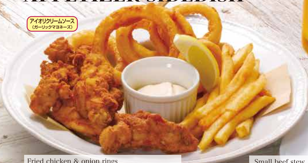
Fried chicken & onion rings フライドチキン&オニオンリング