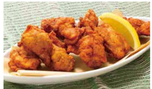
Fried chicken フライドチキン