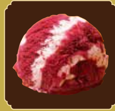
Cassis cream カシスクリーム

ベルギーチョコレートの しっかりとした甘さとコクを 合わせもつ、なめらかな 味わいです。