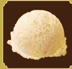
Vanilla bourbon バニラブルボン

パフェやサンデーなどのアイスは 美味しさにこだわった ベルギー産アイスを 使っています。