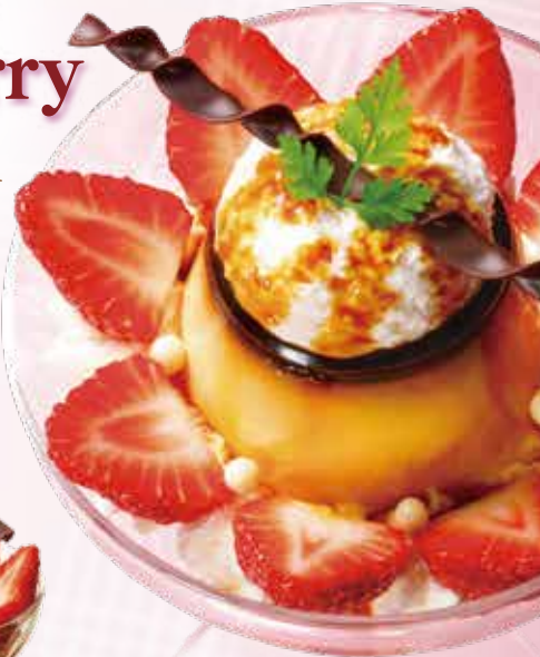
Strawberry and pudding à la mode parfait 苺のプリン・ア・ラ・モードパフェ 1,580円 (税込 1,738円)

まるやかなプリンに塩キャラメルアイスとほんのり甘ずっぱいベリームースを合わせた、苺とプリンを存分に楽しめる贅沢なプリン・ア・ラ・モードパフェ。