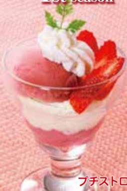
プチストロベリーパフェ