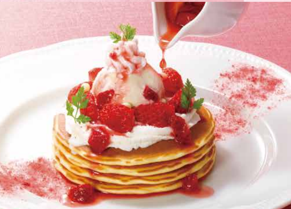
Pancake with strawberry and melting vanilla ice cream とろけるバニラアイスクリームの苺パンケーキ 1,580円 (税込 1,738円)

ちいさめパンケーキの上にベリームース、バニラアイスクリームをのせ、苺を飾りました。フレッシュな苺入りの温かいストロベリーソースをかけてどうぞ。