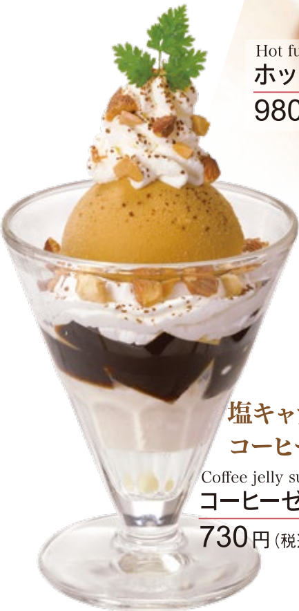
塩キャラメルアイスと コーヒーゼリー Coffee jelly sundae コーヒーゼリーサンデー 730円 (税込 803円)