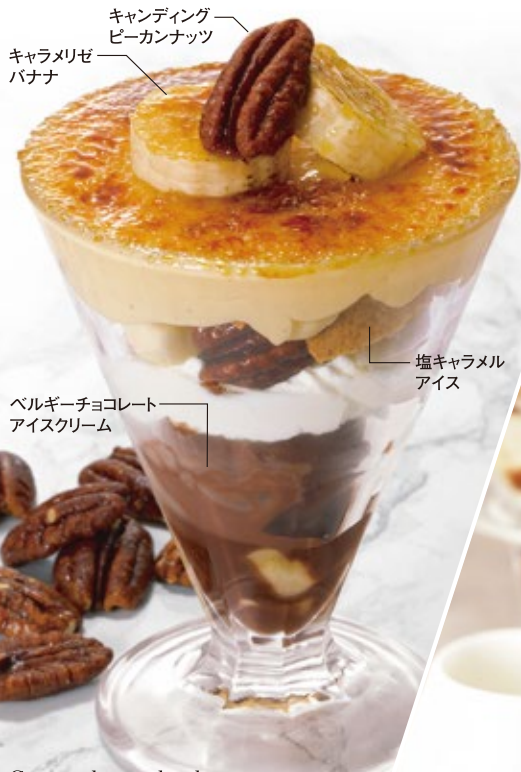
Caramel nuts brulee キャラメルナッツブリュレ 780円 (税込 858円)