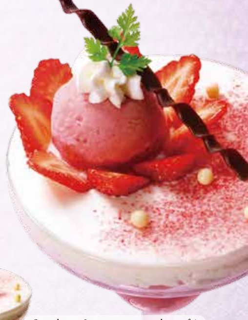
Strawberry & cocoa sponge cake parfait 苺のふんわりショートケーキ仕立て 1,280円 (税込 1,408円)

ふんわり柔らかなココアスポンジをホイップクリームで包み、苺のソルベ、ベリームースを重ねたグラスで楽しむショートケーキ。表面のパールチョコと苺パウダーがかわいらしさを添えています。