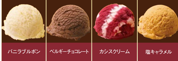
バニラブルボン ベルギーチョコレート カシスクリーム 塩キャラメル