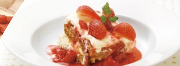
Homemade strawberry tiramisu 自家製ストロベリーティラミス 620円 (税込 682円)