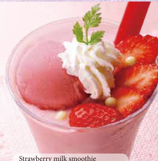
Strawberry milk smoothie 苺みるくのスムージー 880円 (税込 968円)

苺みるくのスムージーにベリームースを合わせ、苺のソルベと苺、ホイップクリームを添えました。混ぜるほどに苺やベリーの味わいが豊かになる美味しさをご堪能ください。