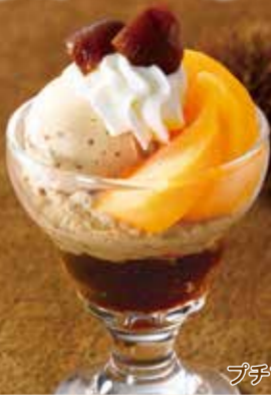
プチマロンパフェ