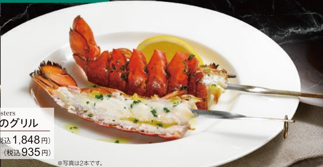
Grilled homard lobsters オマール海老のグリル 2本 1,680円(税込1,848円) 1本 850円(税込935円)