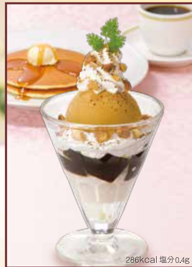
286kcal 塩分0.4g Coffee jelly sundae コーヒーゼリーサンデー セット 1,080円+税