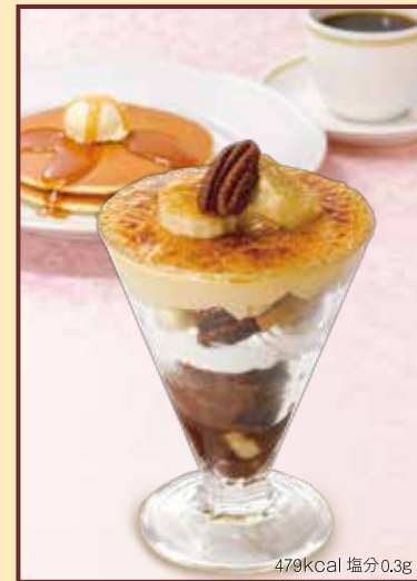
479kcal 塩分0.3g Caramel nuts brulee キャラメルナッツブリュレ セット 1,180円+税