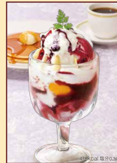
478kcal 塩分0.3g Yogurt Germany ヨーグルトジャーマニー セット 1,130円+税