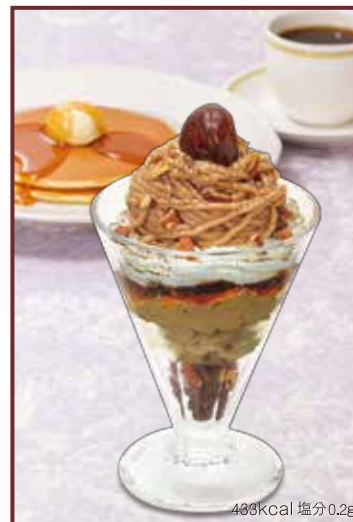
486kcal 塩分0.2g Mont blanc aux marrons style of astringent chestnut and Hojicha 渋皮栗とほうじ茶のモンブランパフェ セット 1,280円+税