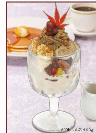
599kcal 塩分0.3g Astringent chestnut and Hojicha sundae comes with Hojicha sauce 渋皮栗とほうじ茶のサンデー ~温ほうじ茶ソース~ セット 1,380円+税