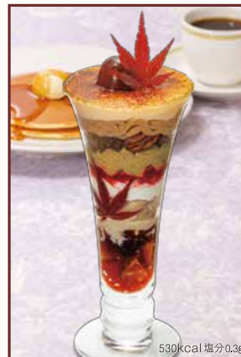
530kcal 塩分0.3g Brulee parfait of astringent chestnut and Hojicha 渋皮栗とほうじ茶のブリュレパフェ セット 1,480円+税