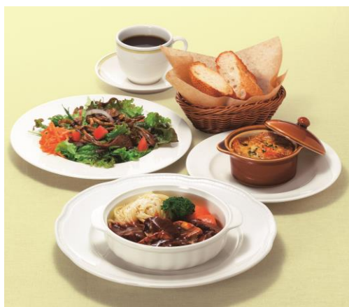
(写真はセットイメージ)